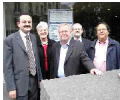
Members of the Historical Demography Committee and local organiser during the Paris seminar on the New History of Kinship.

The IUSSP Scientific Committee on Historical Demography organised a seminar on The New History of Kinship in collaboration with the Institut National d'Etudes Démographiques (INED), l'Ecole des Hautes Etudes en Sciences Sociales (EHESS), with institutional support from the Research Group in Economic Demography at Lund University, Sweden. Financial support was provided by INED, the French Ministry of Foreign Affairs, the EHESS, and the IUSSP. The seminar brought together international specialists working in the field of historical kinship studies to discuss recent research on extended kinship and family networks. The authors of the fourteen papers presented at the seminar adopted one of two approaches. The first approach considered kinship as socially constructed and the second approach viewed kinship from a biological and genetic perspective; all papers focused on the effect of extended kinship on demographic and social outcomes including mortality, fertility, migration and social mobility.